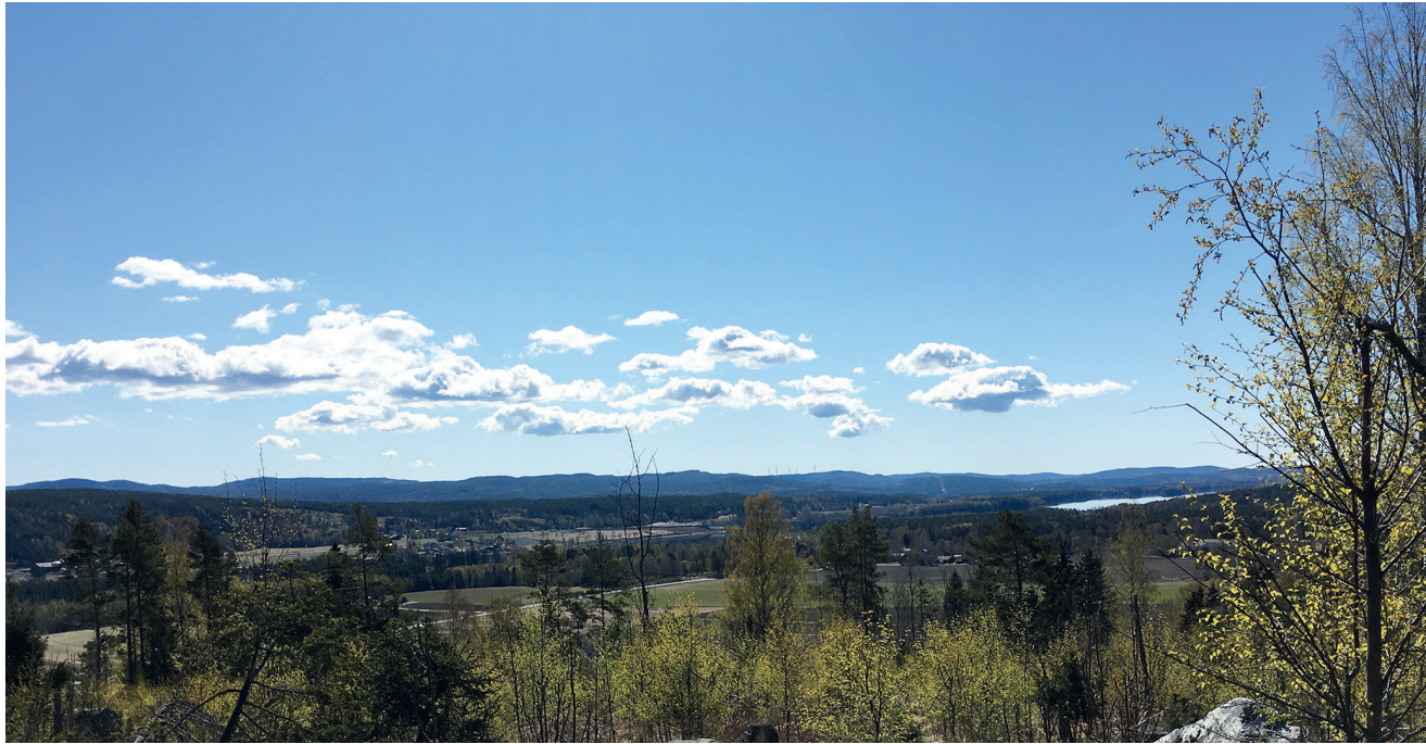
Utsikten från Vårdkasen över Ångermanälven är vidunderlig