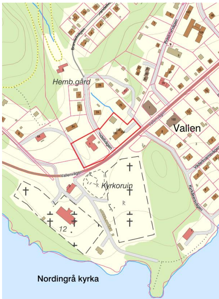
Karta 1: Röd linje redovisar det ungefärliga planområdesgränsen.