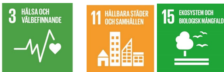
Bild 3. Några av de viktiga målområdena o Agenda 2030 som direkt har anknytning till tätortsskog.

Beroende på hur skogen nära bebyggelse sköts kommer också den produktiva skogsmarken att behöva skötas med hänsyn tagen till att den ligger nära bebyggelse. I detta fall handlar det om val av skogsbruksmetoder och också vilken tid under året som åtgärden görs. Idag kan vi identifiera 350 ha såsom skog inom tätort och i det fallet ska inte skogen skötas med målet att generera ekonomisk avkastning. I dessa områden är det viktigt att skogen kommer att upplevas såsom en del av den levande tätorten där utrymme finns för aktiviteter kopplade till människor som bor och vistas i området. Området med tätortsskogar är tvärvetenskapligt. Det handlar om skogskunskap, miljöpsykologi och Biologi med mera. Området är också viktigt ur Agenda 2030-perspektiv och målen 3.4, 11.7, 15.1, 15.2 och 15.5