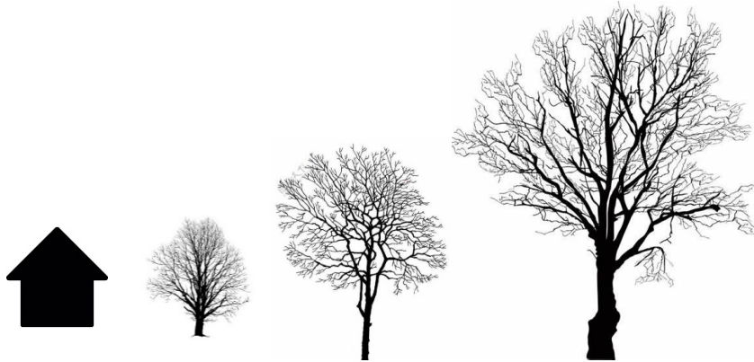
Bild 1. Träd växer långsamt. Olika storlekar blir olika betydelser för omgivningen.

Det är lätt att glömma alla trädets biologiska värden och ekosystemtjänster när det blir skugga på altanen eller utsikten döljs. Mycket hänsyn till detta tas redan i de bostadsnära zonerna och utöver denna är vi mycket restriktiv med ytterligare utglesning. Vissa undantag kan göras för solceller och teknisk infrastruktur.