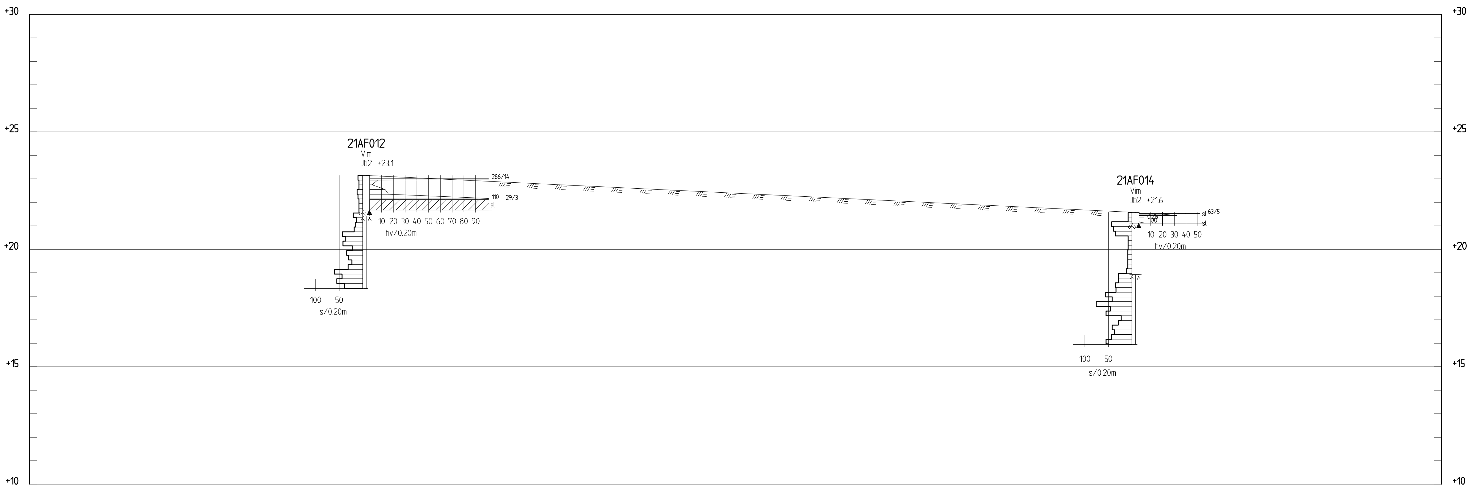
SEKTION G-G 1: 100